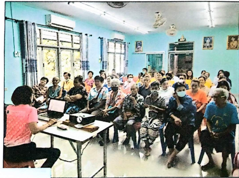
กิจกรรมการอบรม