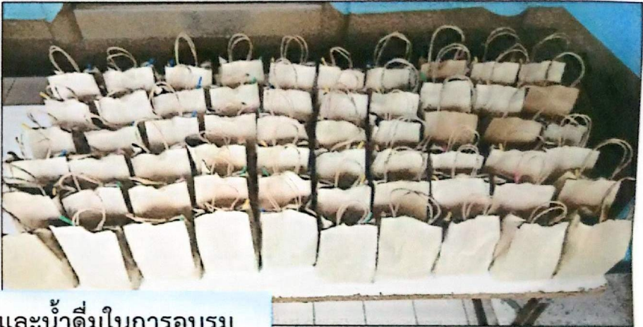
อาหารกลางวัน อาหารว่างและน้ำดื่มในการอบรม